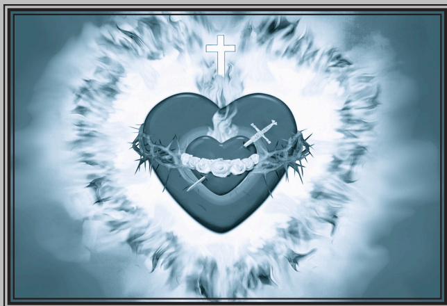
Imagen de los Corazones Unidos de la Santísima Trinidad y de María Inmaculada