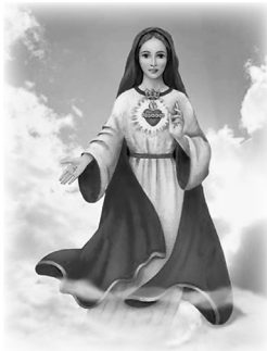
La Imagen de María Refugio del Amor Santo

Las revelaciones de María Refugio del Amor Santo y de los Aposentos de los Corazones Unidos (Los Secretos Revelados). En 1993, Nuestra Señora pidió que la Misión se diera a conocer como los Ministerios del Amor Santo .