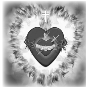
La Imagen Completa de los Corazones Unidos de la Santísima Trinidad y del Inmaculado Corazón de María